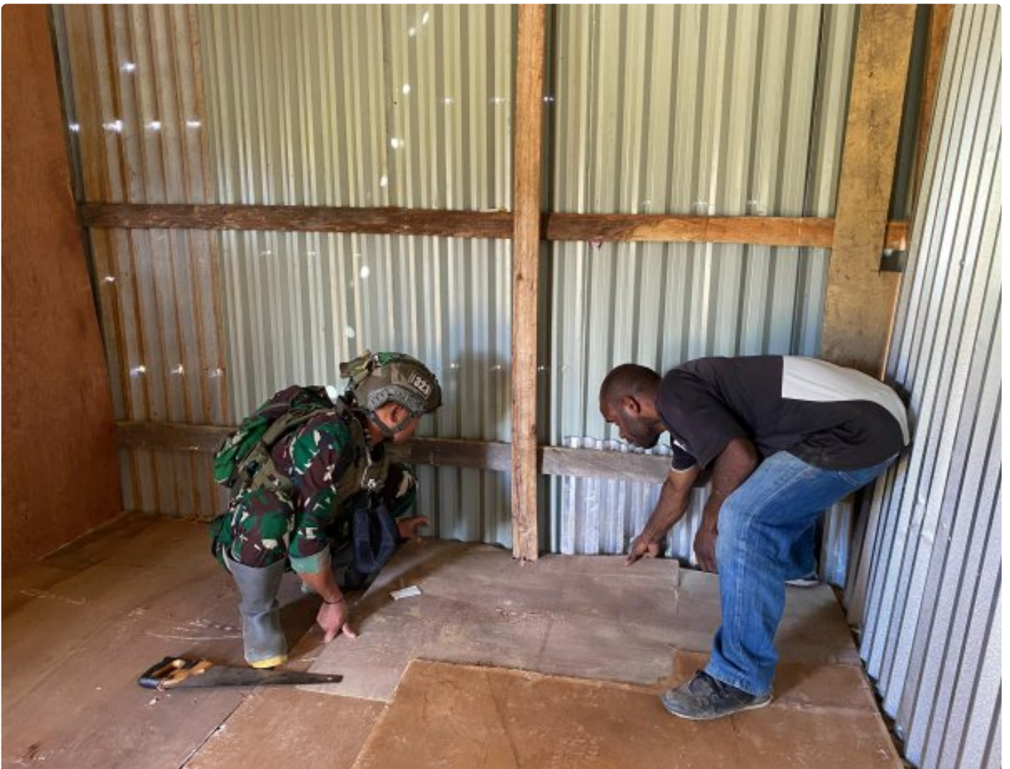
Satgas Yonif 323 Buaya Putih Titik Kuat Kodim Persiapan Membantu Masyarakat membangun Warung

Satgas Yonif 323 Buaya Putih Kostrad yang bertugas di wilayah pedalaman Papua kembali menunjukkan komitmennya dalam membantu masyarakat setempat, Kali ini, Satgas Yonif 323 Buaya Putih Kostrad Titik Kuat Kodim Persiapan membantu warga di salah satu kampung terpencil yaitu Kampung