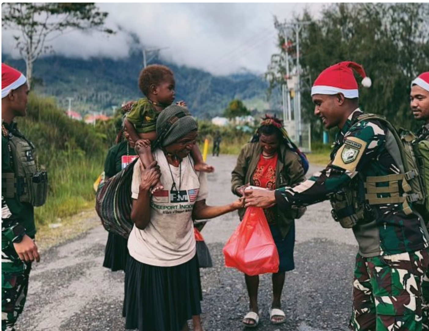
Foto: Satgas Yonif 509 Kostrad memberikan makna baru pada patroli keamanan dengan berbagi kebahagiaan bersama masyarakat di Intan Jaya, Papua.

PAPUA- Dalam balutan semangat Natal yang damai, Satgas Yonif 509 Kostrad memberikan makna baru pada patroli keamanan dengan berbagi kebahagiaan bersama masyarakat di Intan Jaya, Papua. Dipimpin oleh Pasiter Satgas, Lettu