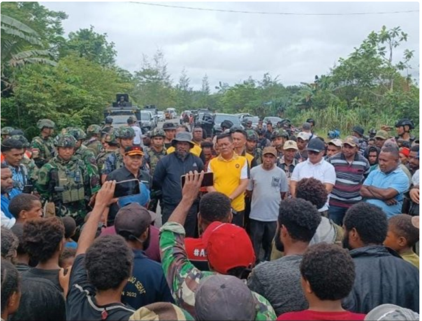
Foto: Satgas Batalyon Infanteri 6 Marinir Bersinergi Dengan Pemda Kabupaten Yahukimo Laksanakan Komunikasi Sosial Papua. Senin (01/07/2024).

YAHUKIMO- Satuan Tugas (Satgas) Batalyon Infanteri 6 Marinir merupakan bagian dari Komando Operasi TNI (Koops) Habema bersinergi dengan Pemda Kabupaten Yahukimo laksanakan Komunikasi Sosial di wilayah Yahukimo,